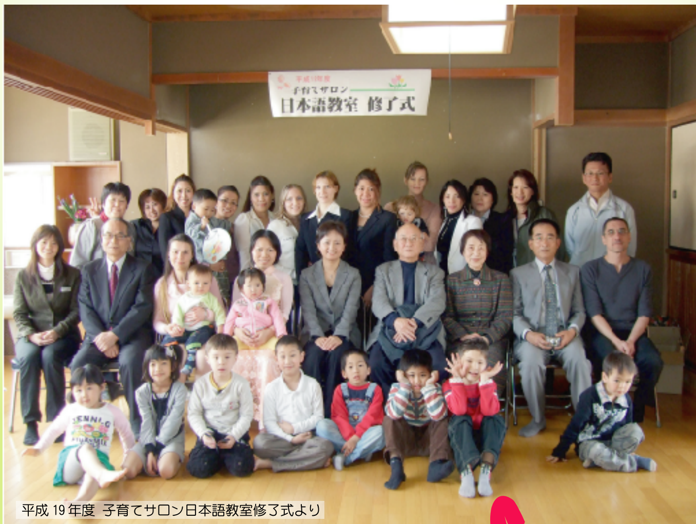
平成 19年度 子育てサロン日本語教室修了式より