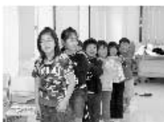
仲間づくりも大切です