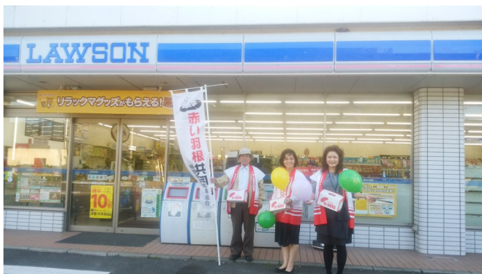
平成29年10月3日ローソン上野店にて

今年も10月1日から、全国一斉に赤い羽根共同募金運動が実施されています。福智町でもさまざまな共同募金運動を行っていますが、各地域の区長さんや組長さん、民生委員さん、福智町社会福祉協議会の理事、監事、評議員さんの皆様にはご協力をいただいておりますことに、心よりお礼申し上げます。本当にありがとうございます。