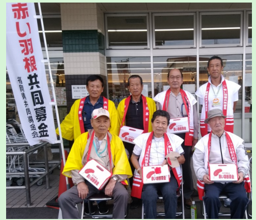
令和元年10月8日身障福祉会による街頭募金

より良い地域づくりのために、一人でも多くの方々に寄付やボランティアを通じて共同募金運動に参加していただけるよう取り組んでいきますので、引き続きご協力をお願い致します。