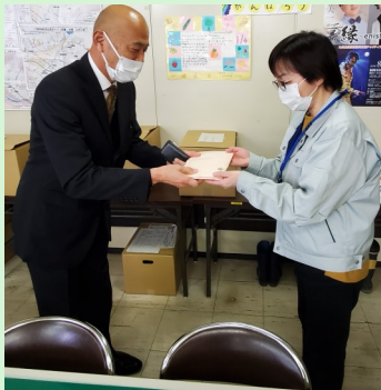
朝倉市復興推進室

ボランティア連絡協議会では、このような活動を通してボランティア活動の普及と発展を目指し活動を続けていきますので、皆様のご協力とご支援をよろしくお願い致します。